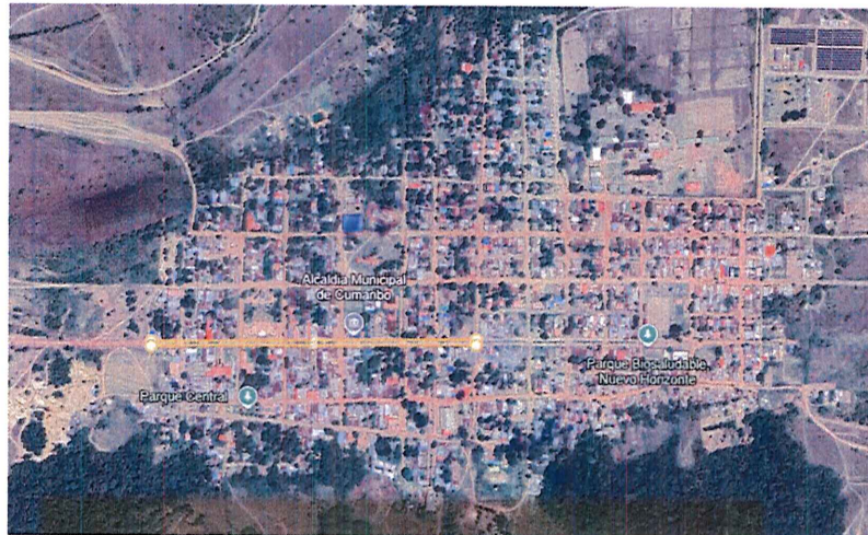
Figura 2 Localización específica de las vías a pavimentar